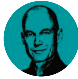
Bertrand PICCARD Initiateur et Président de la Fondation Solar Impulse